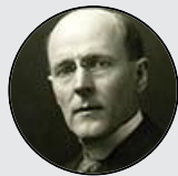
Paul Harris Fundador de Rotary

Más allá de lo que Rotary signifique para nosotros, el mundo lo conocerá por las obras que realice.