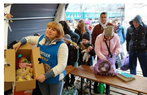
Voluntarios en el conflicto de Ucrania