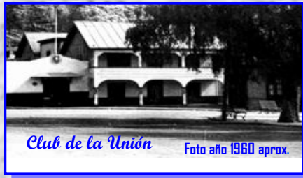
Club de la Unión

El Club de la Unión tenía su sede en una casa de dos pisos frente a la frondosa Plaza Colón, un verdadero pulmón verde que refrescaba a los ariqueños.